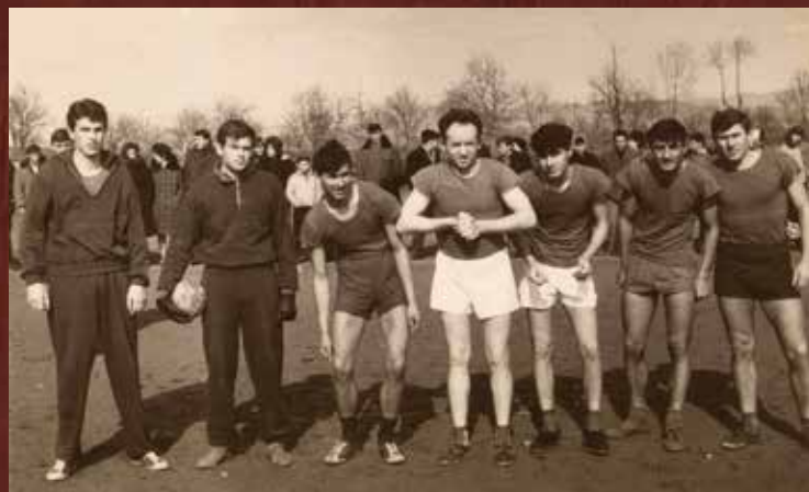
Košarkaška ekipa „Mladost“, susret s ekipom iz Šibenika; svibanj 1963. godine