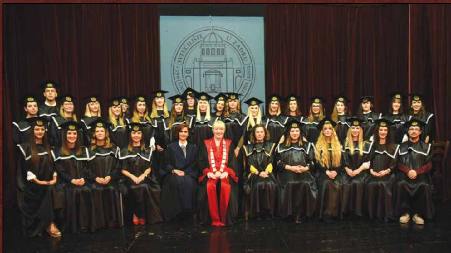
Promocija studenata, 2018. godina