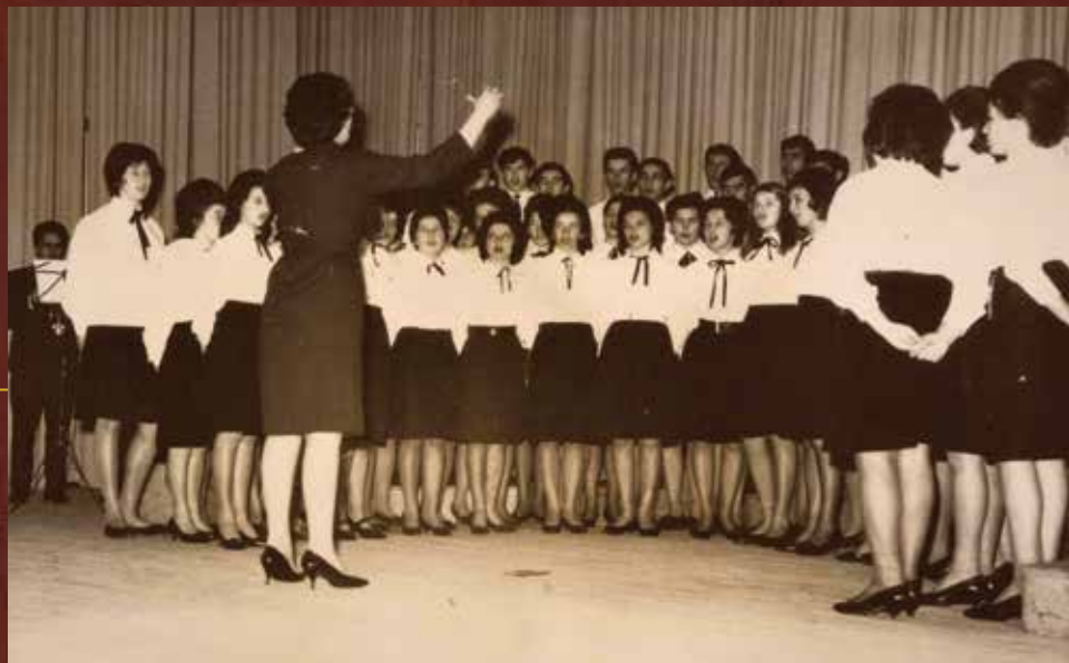
Zbor Učiteljske škole, 8. ožujka 1964. godine