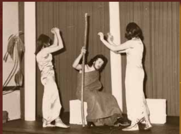
Predstava u izvedbi studenata Pedagoške akademije