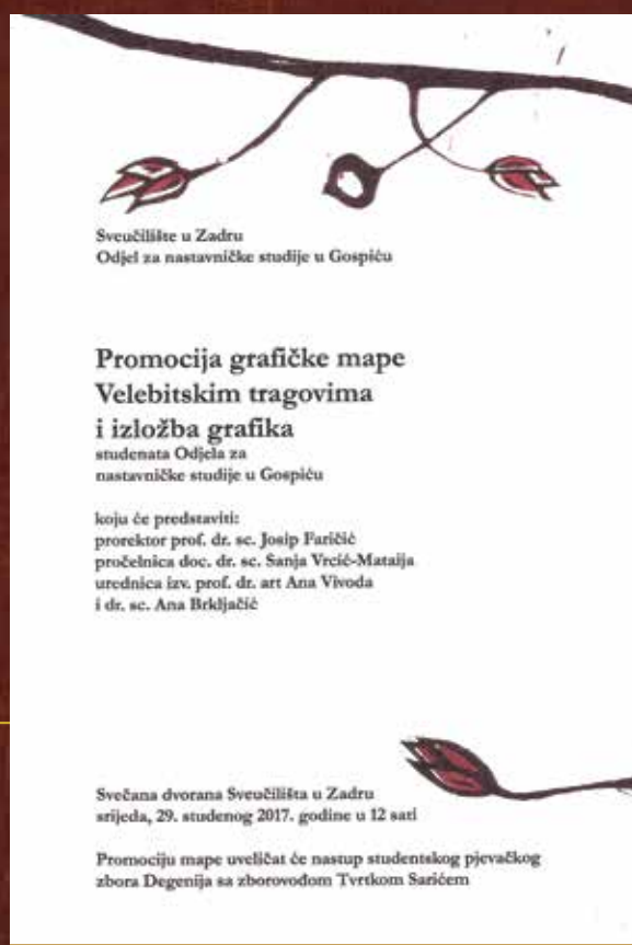
Plakat za promociju grafičke mape Velebitskim tragovima i izložba grafika, 2017. godina