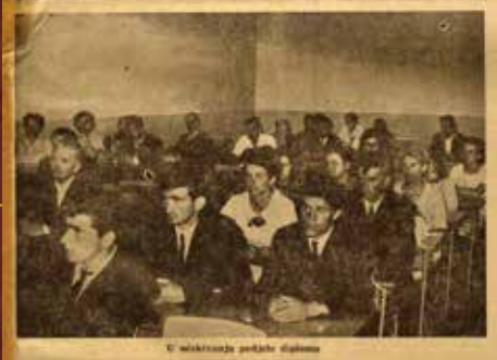
U rukopisanju pedagoških diploma