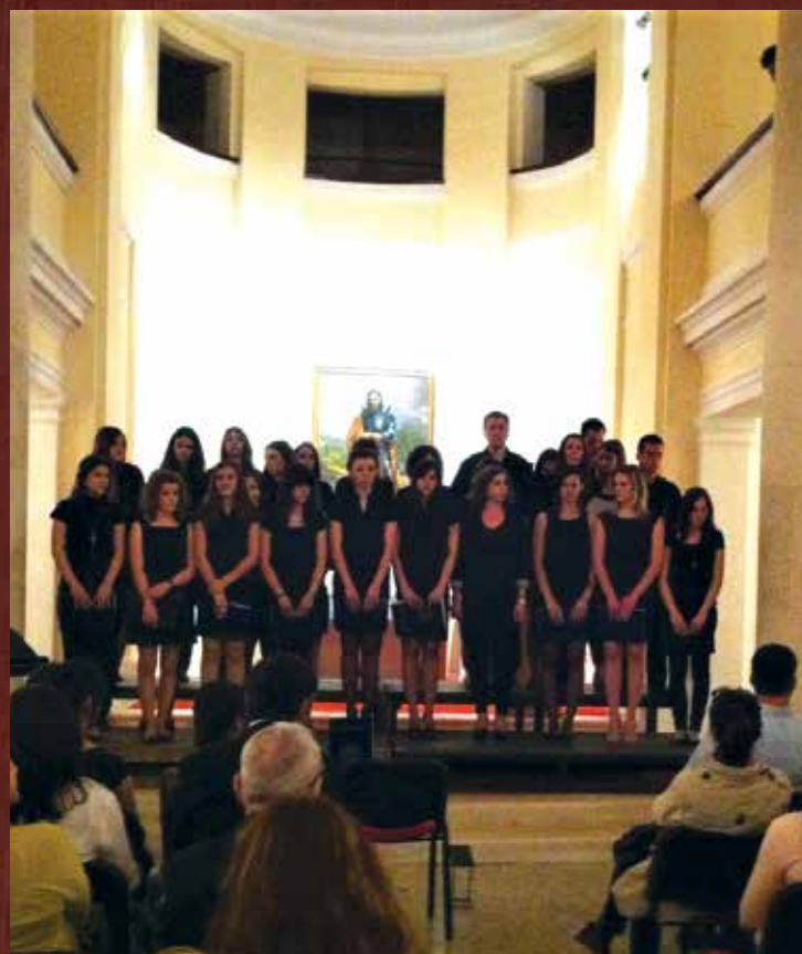
Nastup studentskog zboru Degenija u Sveučilišnoj kapeli Sv. Dimitrija u Zadru, 2016. godine