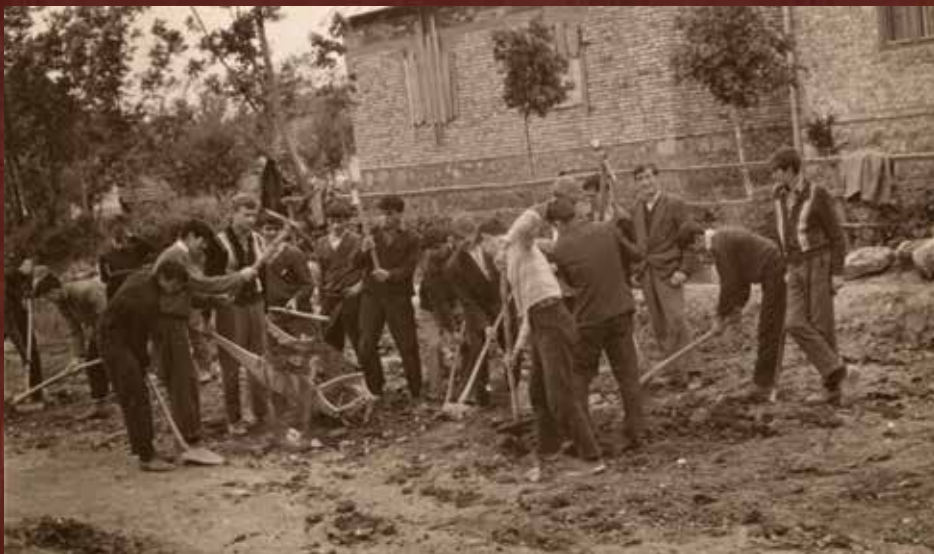
Radna akcija učenika Učiteljske škole na izgradnji ceste u Bilaju, proljeće 1962. godine