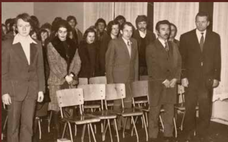
Profesori Pedagoške akademije